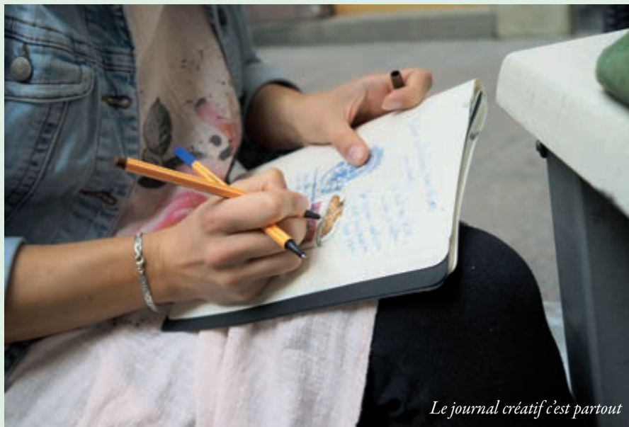
Le journal créatif c'est partout